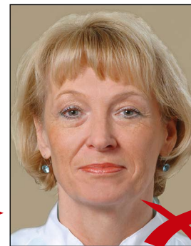
Hintergrund ohne Kontrast