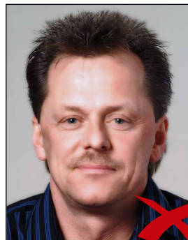
Reflexion im Gesicht