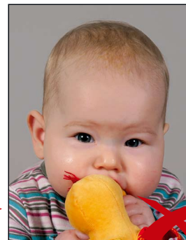
Gegenstand im Bild