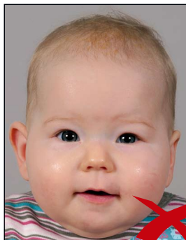
Kopf zu groß