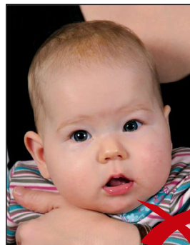
Zweite Person im Hintergrund